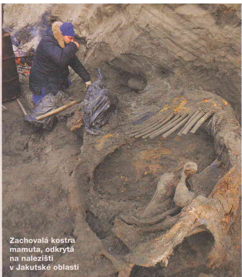
Zachovalá kostra mamuta, odkrytá na nalezišti v Jakutské oblasti

K aždých 15 minut zastřelí pytláci v Africe jednoho slona. Za posledních devět let byla kvůli klům vybita více než třetina těchto zvířat. Pokud se v řádu několika málo let nepodaří ilegální obchod se slonovinou vymýt, budeme největšího suchozemského savce znát jen z obrázků.